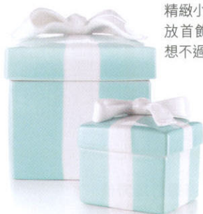
藍色的陶瓷匣子像精緻小禮物，用來存放首飾或小物最理想不過。(Tiffany)