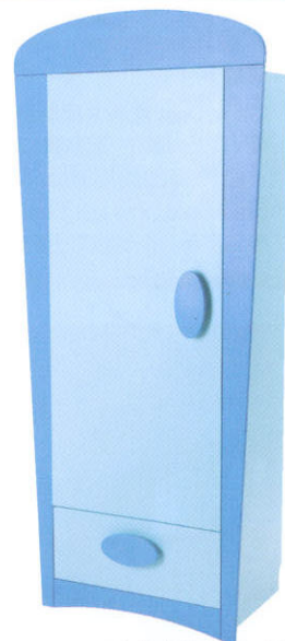
Mammut衣櫥採用再生木材製成，包含了可供調校的層架、抽屜及掛衣軌；產品是設計師M Kjelstrup及A Östgaard合作的結晶品。(IKEA)