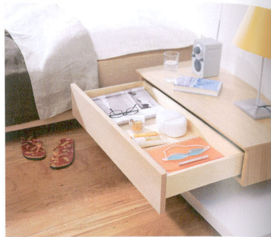
採用隱藏式技術組裝而成的Tandem抽屜，有效提升房間的儲物容量，配合特別配件後，更能變成無把手設計，使空間更見簡潔利落。(Blum)