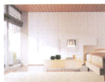
有了以趟摺門設計的Spazio衣櫥，配合內裡簡約清晰的間格，有助我們整齊妥善地收納及展示衣飾，從此存取衣服時便能一目了然；帶木紋圖案的白色焗漆櫃組，時尚優雅。(I & D)