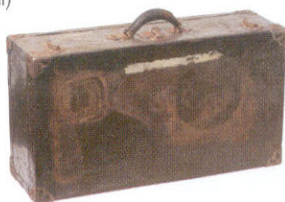
用行李箱儲存不常穿的衣服或不常用的物品，是不錯的儲物方案！對於偏愛古董行李箱的人來說，這個來自美國的古董鑲皮行李箱，可謂只可遇而不可求，而花斑斑的鐵鏽令它散發獨特氣質。(Initial)