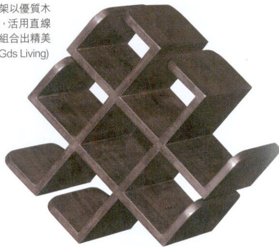
實木酒架以優質木料製造，活用直線和圓角組合出精美造型。(Gds Living)