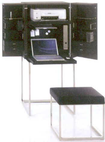
André Schelbach設計的Magic Cube是一件獨立的活動家具，內部間隔有三種選擇：電腦工作桌、梳妝桌，以及咖啡/酒吧。電腦工作桌的皮革桌面可以伸延，抽屜就在工作桌左右兩邊，筆記簿型電腦和打印機擺放位置考慮工效學，務求提升使用者的工作效率。(Yomei)