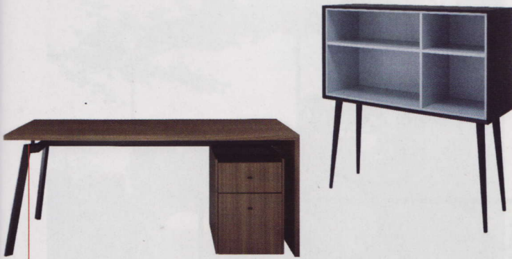
Work & Look + Kermes

› Da auch die Ansprüche im Home Office steigen, haben Pagnon & Pelhaître einen großzügigen Schreibtisch und dazu passenden Rollcontainer entworfen. Mit einer Breite von 180 Zentimetern und einer Tiefe von 90 Zentimetern bietet der Tisch genügend Platz für ein effizientes Arbeiten – auch daheim. Das Gestell besteht auf der einen Seite aus einer Platte, die im rechten Winkel an die Tischplatte anschließt und auf der anderen Seite aus angewinkelten Stahlrohren mit einer stabilisierenden, mittigen Metallverbindung. Neben einem Tisch zum Arbeiten benötigt man, auch im Home Office, Stauraum – sei es für Bücher, Akten oder einfach nur Unterlagen. Kermes von Ligne Roset ist eine offene Anrichte mit vier Fächern. Das Möbel ist in zwei Farbvarianten erhältlich: außen in schwarz getöntem Eschenfurnier und innen entweder in Lack rot oder lavendelblau. Die schmalen Füße verleihen der 120 Zentimeter breiten und 40 Zentimeter tiefen Anrichte eine Höhe von 125 Zentimetern. ◀